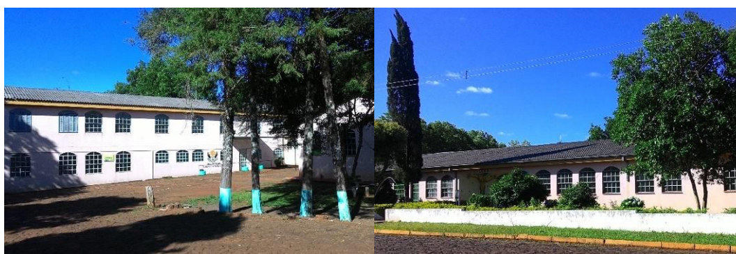
Figura 2 e 3 – Prédio do Antigo Seminário Diocesano Divino Mestre

A APAE na cidade de Pejuçara foi fundada em Assembleia, no dia 18 de agosto de 2004, sendo uma associação civil, beneficente, com atuação nas áreas de assistência social, educação, saúde, prevenção, trabalho, profissionalização, defesa e garantia de direitos, esporte, lazer, estudo, pesquisa e outros, sem fins lucrativos ou de fins não econômicos (ESTATUTO DA APAE DE PEJUÇARA, 2015).